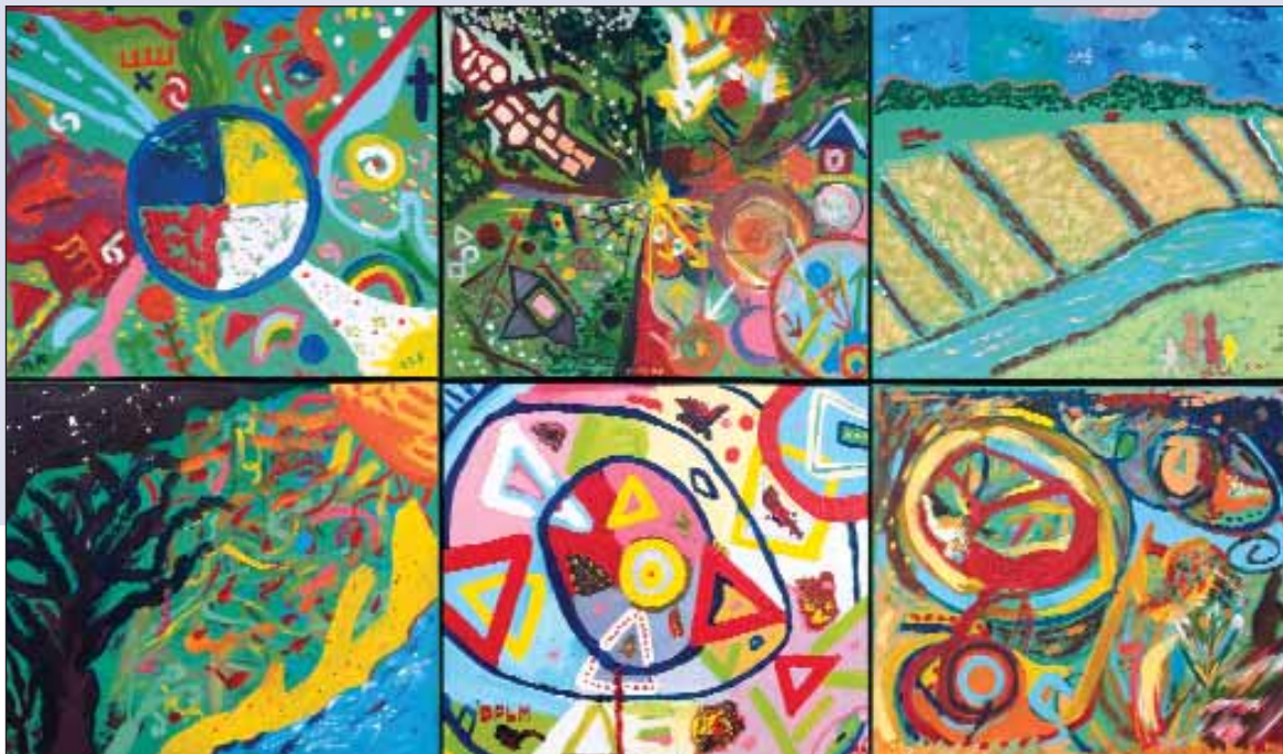
'Growth & Innovation' vervaardigd door The Top Guest Providers and employees of the Torarica Group of Hotels, 2006 | Locatie: The Edge Bar, Torarica Hotel & Casino.