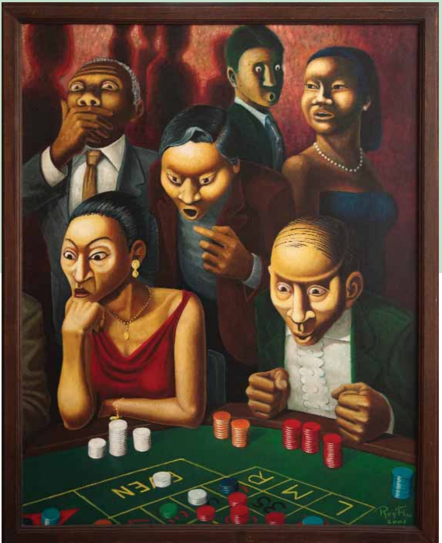
Schilderij: 'Als het balletje rolt', Ron Flu, 2001 | Locatie: Casino, Torarica Hotel & Casino.