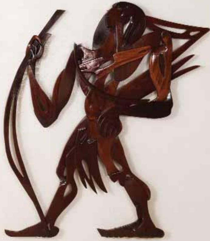
Houten indianen, ontworpen door Noni Lichtveld, 1962 | Locatie: Entree Torarica Hotel & Casino.

zittingen bij de Bemiddelingsraad voor geheel Suriname zijn deze verschillen weggewerkt en is er intussen een voor alle partijen bevredigende CAO afgesloten en ondertekend voor de periode 1 juli 2009 - 30 juni 2011.