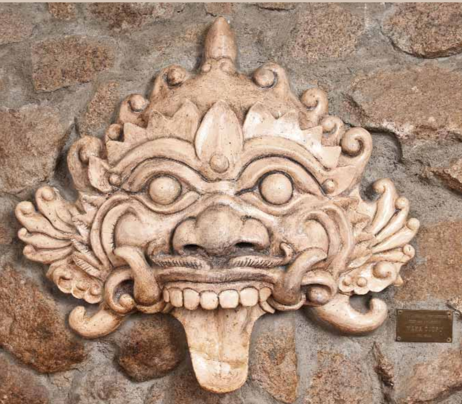
Javaans beeld, ontworpen en vervaardigd door het Waka Tjopu Collectief | Locatie: oorspronkelijk 'Het Koffiehuis', thans Lobby Bar, Torarica Hotel & Casino.