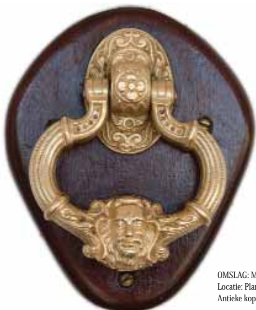
OMSLAG: Muurschildering: 'The many faces of Suriname' vervaardigd door Nic Loning, 1962 | Locatie: Plantation Room, Torarica Hotel & Casino. Antieke koperen deurklopper | Locatie: voordeur Welcome Center, Eco Resort Inn.