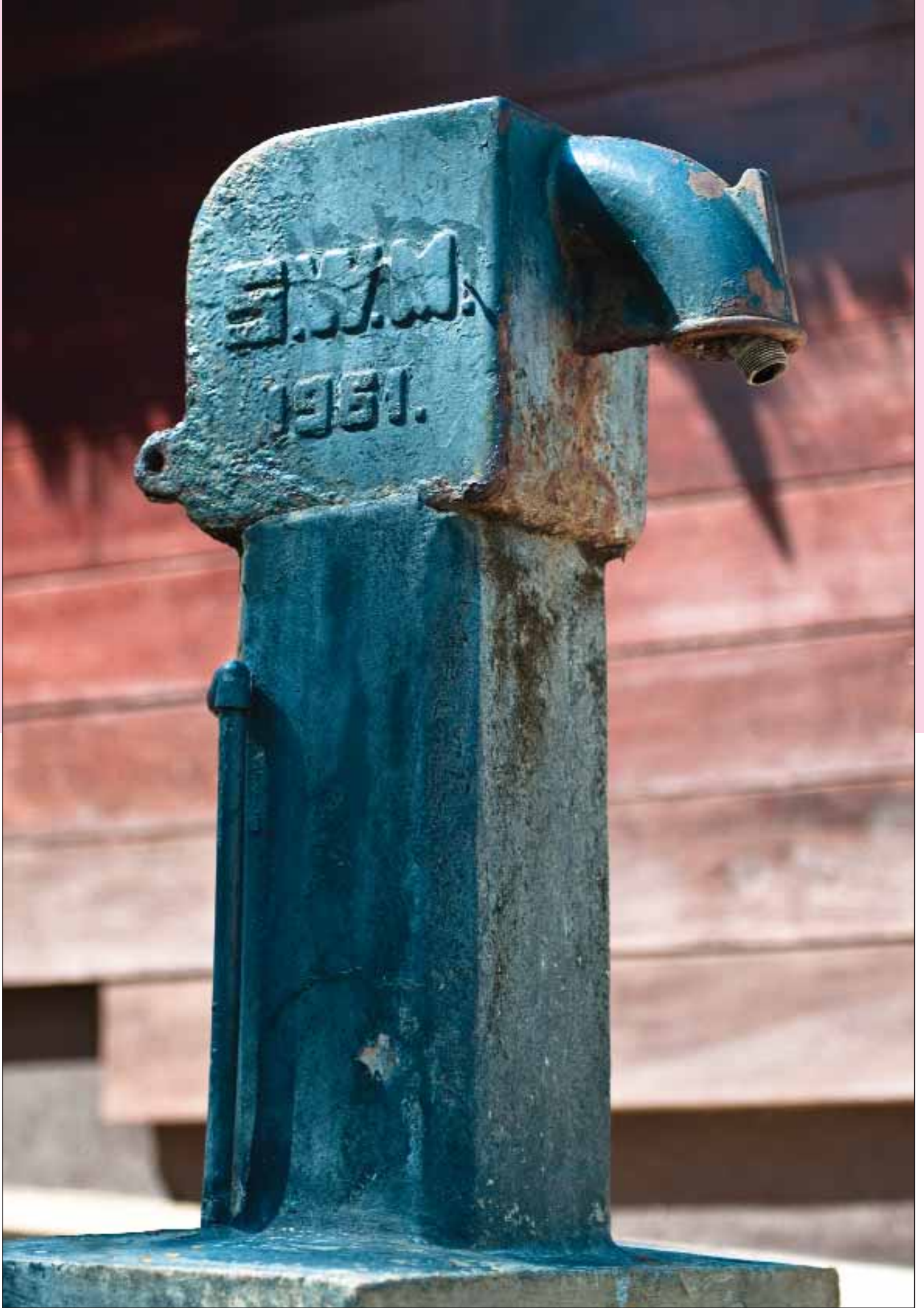
Massief ijzeren kraan SWM, 1961 | Locatie: Tuin van Torarica Hotel & Casino.