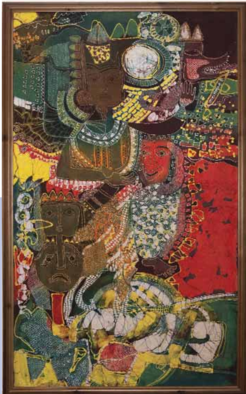
Deze en volgende pagina: Batik doeken: 'De laatste strijd', Soeki Irodikromo, 1989. Locatie: Oorspronkelijk in 'Het Koffiehuis', thans geplaatst op de 2 e verdieping naast de lift van Torarica Hotel & Casino.